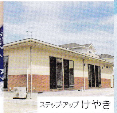
ステップ・アップ けやき